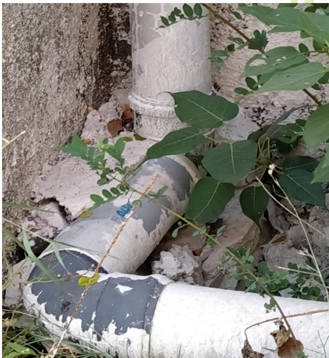
fig:- pipes joined